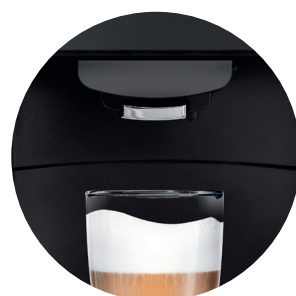
automatyczne czyszczenie systemu mlecznego