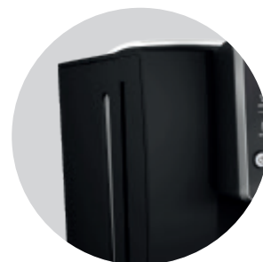
2-litrowy zbiornik wody