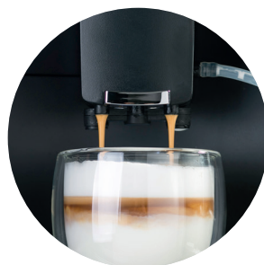
funkcja One Touch Cappuccino